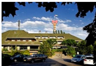
14. Mai - Moers