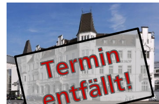
24. April - Bielefeld