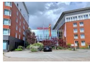
16. Mai - Münster