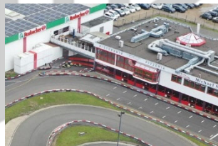
23. April - Kerpen