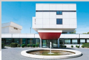
18. April - Dortmund